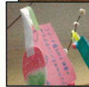
小正月にちなんでボランティア

アサークルびよっこの皆さんから「だんご下げ」を飾っていただきました。紅白のだんごは手づくりで、七夕のように願いごとの短冊もさげられています！お立ち寄りの際はぜひご覧ください。