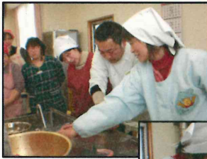
1月15日(日)開催 ソーセージ作り