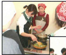
1月29日(日)開催 冬野菜のイタリアン